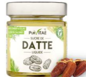
SUCRE DE DATTE