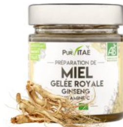
MIEL BIO À LA GELÉE ROYALE ET GINSENG