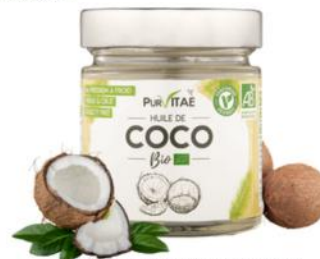
HUILE DE COCO BIO