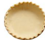
Pâte brisée sans gluten