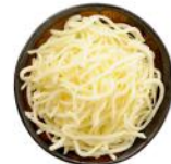
Mozzarella râpée (50g)