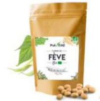
Farine de fève bio Pur Vitaé (30g)